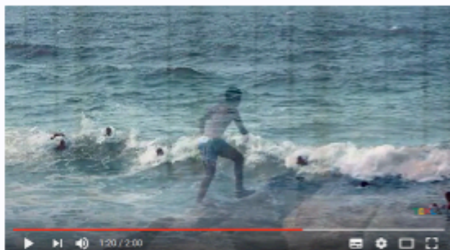
BookTrailer I tuffatori di Casablanca